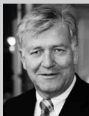
Ständerat Bruno Frick (CVP, SZ)