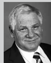
Ständerat Rolf Schweiger (FDP, ZG)