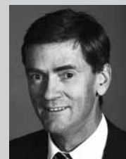
Ständerat Pankraz Freitag (FDP, GL)