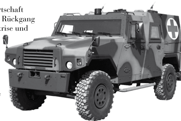
Schweizer Sicherheits- und Wehrtechnik schützt weltweit Polizisten, Soldaten und internationale Friedenstruppen. Hier im Bild ein geschütztes Ambulanzfahrzeug EAGLE der Firma GDELS-Mowag GmbH.

Das Staatssekretariat für Wirtschaft Seco gibt als Gründe für den Rückgang der Exporte die Konjunkturkrise und den schwachen Euro-Wechselkurs an. Unterschlagen wird die Tatsache, dass auch der bundesrätliche Exportstopp nach Ägypten, Pakistan und Saudi-Arabien für ausbleibende Aufträge verantwortlich ist.